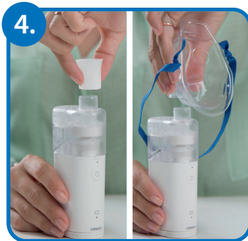
Namestite vmesnik za uporabo z masko ali ustnikom