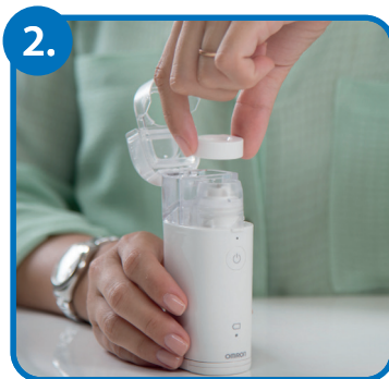
Namestite pokrov mrežice